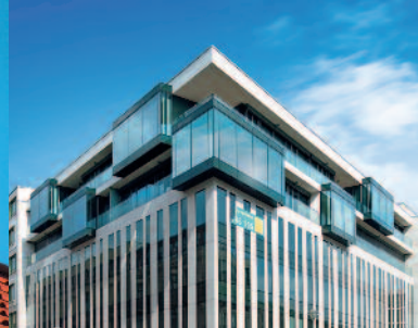
Wand / Fassade