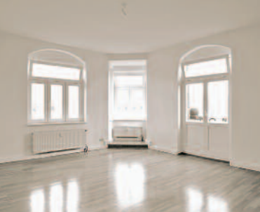
Ausbau / Trockenbau